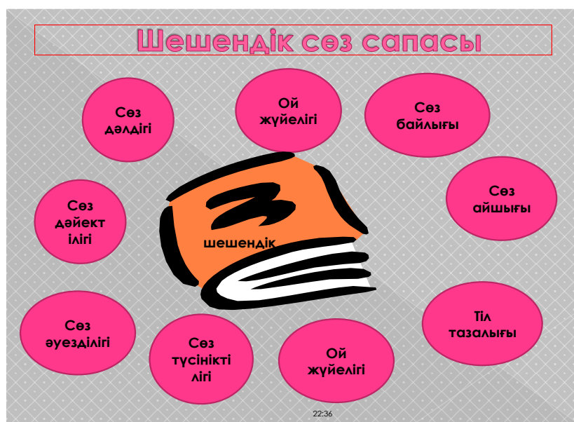
Сурет 2. Шешендік сөз сапасы

Осы жоғарыдағы қазақ даналығының айғағы іспеттес тарихы ежелден бастау алатын ұлттық құндылықтарымызды айқындаған, халықтық дәстүрді саралаған тілі ділмәр, шешендердердің ішінде сөзі ерек Төле биді айтуға болады.