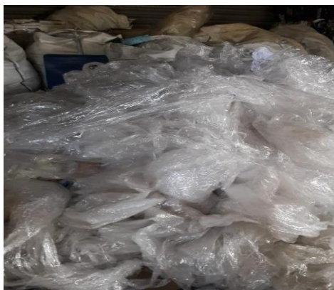
Рис. 2. Фотография вторичного полиэтилена (ПЭНП)