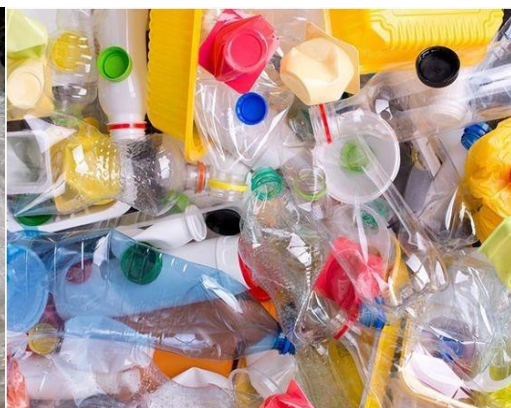
Рис. 3. Внешний вид образцов вторичного полиэтилентерефталата (ПЭТФ)

В работе Г.А. Бонченко [24] с целью решения вопроса о применении вторичного (постаревшего) полиэтилена в асфальтобетонных смесях были проведены экспериментальные исследования физико-механических свойств полиэтилена низкой плотности (пленка сельскохозяйственного назначения, бывшая в употреблении 6-8 месяцев) и полиэтилена высокой плотности (упаковочный материал и тара). В таблице 1 представлены Физико-механические показатели первичного и вторичного ПЭ.