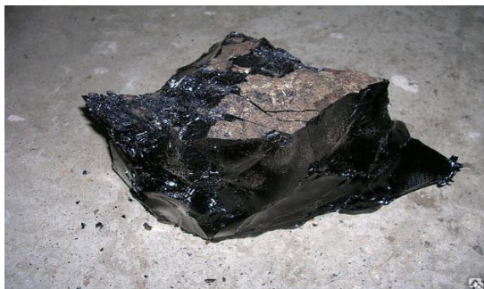
Рис. 1. Общий вид нефтяного битума

Качество битума в значительной степени определяет качество и сроки службы дорожных асфальтобетонных покрытий, поскольку все характерные особенности свойств асфальтобетона как термопластичного материала определяются свойствами битума. Например: статистический анализ показывает, что продолжительность эксплуатации дорожного покрытия в составе минерального битума составляет всего 50-70% от стандартных проходов. Термическая стабильность битумных материалов также низкая, что ограничивает использование изделий из них как жарким летом, так и зимой, особенно в районах с экстремальным континентальным климатом. Нефтехимические битумы имеют низкие характеристики с точки зрения альтернативной деформации. Общий вид нефтяного битума приведен на рисунке 1.