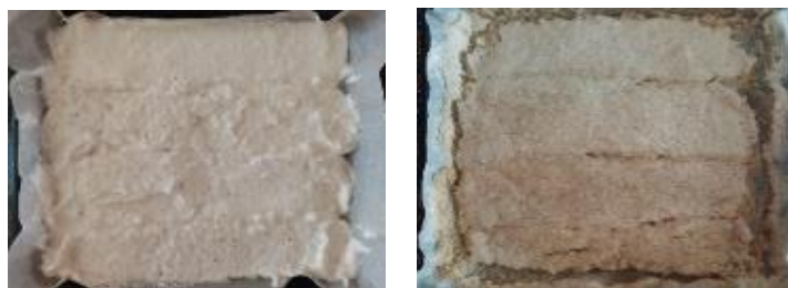
Рис. 2. Визуализация опытных образцов

В результате проведенных экспериментов и анализа данных, наибольшее количество баллов было заработано опытным образцом №1, т.к. он набрал наивысший средний балл - 29,4. Можно выдвинуть гипотезу, что использование лимонной кислоты в качестве консерванта в дозировке 0,1% не ухудшает качества готового изделия. Помимо своего консервирующего действия, лимонная кислота проявляет свойства отбеливающего агента.