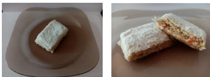
Рис. 5. Фото изделия сахаристого кондитерского