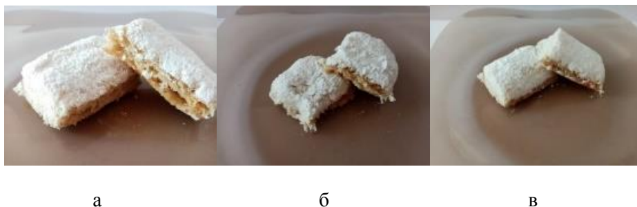
Рис. 4. Визуализация опытных образцов

В результате проведенных экспериментов и анализа данных, наибольшее количество баллов было заработано опытным образцом №1, т.к. он набрал наивысший средний балл - 29,4. Можно выдвинуть гипотезу, что использование перца красного сладкого в качестве дополнительного источника витамина С в количестве 0,5% не ухудшает качество готового изделия. Также добровольцами было отмечено, что благодаря перцу красному сладкому обмазка приобретает красивую красно-розовую окраску.