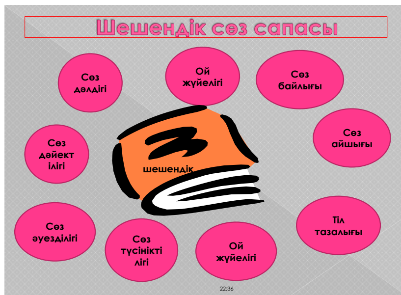
Сурет 2. Шешендік сөз сапасы

Осы жоғарыдағы қазақ даналығының айғағы іспеттес тарихы ежелден бастау алатын ұлттық құндылықтарымызды айқындаған, халықтық дәстүрді саралаған тілі ділмәр, шешендердердің ішінде сөзі ерек Төле биді айтуға болады.