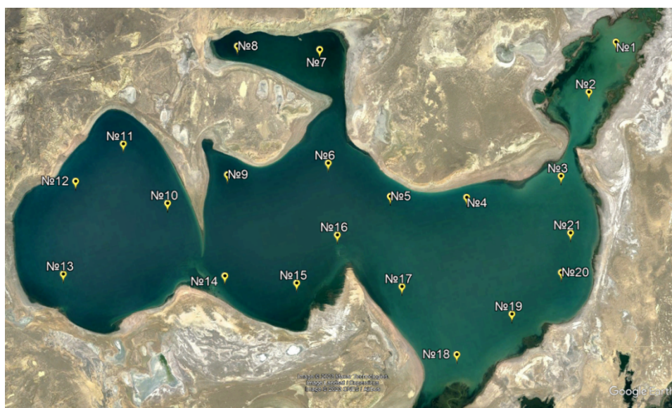
Сурет 1. Кіші Арал теңізіндегі сынама алу бойынша станциялар реті

Кіші Арал теңізін зерттеуді "Балық шаруашылығы ғылыми-өндірістік орталығы" ЖШС Арал филиалы 2022 жылдың көктемгі-жазғы және күзгі кезеңдерінде жүргізді. Сынамалар 6 кәсіпшілік ауданнан (КА) алынды: I КА - Шевченко шығанағы (10,11,12,13 станциялар), II КА–Орталық (9,14,15,16 станциялар), III КА - Бутаков шығанағы (7,8 станциялар), IV КА - Солтүстік-Шығыс (4,5,6 станциялар), V КА - Өзен сағасы (17,18,19,20,21 станциялар) VI КА - Сарышығанақ шығанағы (1,2,3 станциялар) (сурет 1).